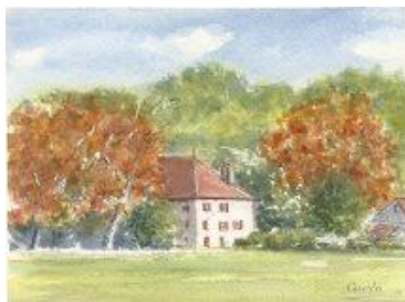
Aquarelle "Château en automne"