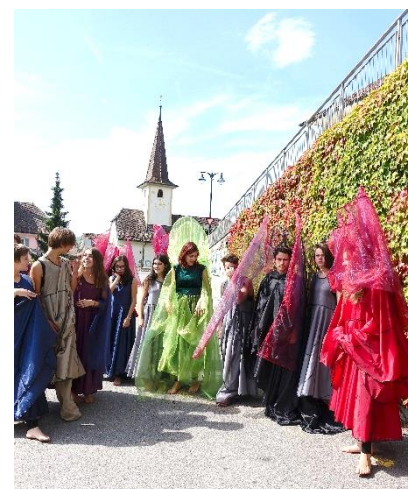
"La Compagnie verte" – premier essai de costumes