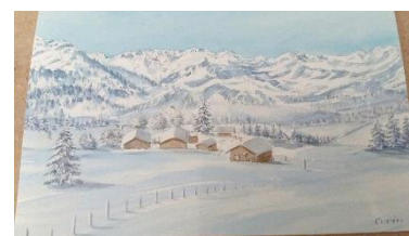
Aquarelle des cartes de vœux