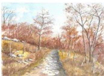
Aquarelle "Chemin d'Entreroches en hiver"

Cette année, une carte de vœux a été éditée pour le compte de SOS Villages d'Enfants sur la base d'une aquarelle de Michel Cavin, la vente des cartes de l'année dernière avec un motif du Jura ayant remporté un grand succès. Si vous le souhaitez, des prospectus sont à votre disposition au bureau de l'administration communale pour la commande de cartes destinées à cette œuvre de bienfaisance.