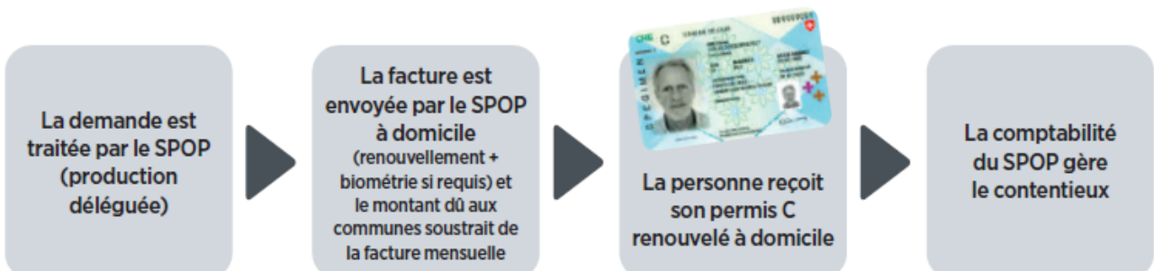
Schéma du processus pour une demande en ligne.